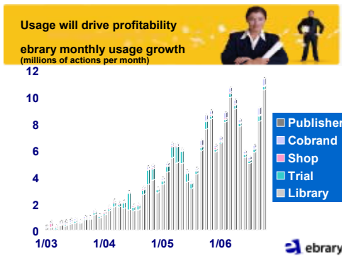
Şekil 1. eBrary Aylık Kullanım Artışı 1

2003'den günümüze olan kullanım artışı firmasının Uluslararası Satış Müdürünün Bologna'da düzenlenen Kasım 2006 tarihli "Akademik kütüphanelerde e-kitaplar" seminerinde yaptığı sunumda kullandığı alttaki grafikte net bir şekilde görülebilmektedir.