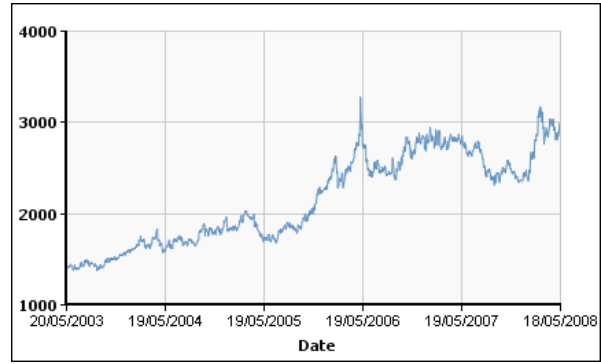
Şekil.1 Londra Metal Borsası Alüminyum Spot Fiyatı

isteklerinin nasıl değiştiğini kestirmek yönünden şirketleri zor duruma düşürmekte. Yani, talep belirsizliği daha da artmakta. 4 Son yıllarda gözlenen spot pazarlardaki fiyat değişkenliği ile beraber talep riskinin artması şirketlerin satınalma ve sipariş karşılama süreçlerini bir hayli zorlamakta. Fiyat değişimlerini görmek için aşağıdaki grafiklere bir göz atabiliriz. Şekil.1 'de birinci tür emtialardan alüminyumun Londra Metal Borsası'ndaki son 5 yıldaki fiyat değişimi ile Şekil.2 'de SD Hafıza kartlarının spot pazarındaki fiyat değişkenliği gözlenmektedir. Alüminyum fiyatlarında açık olarak yükselen bir trend olmakla beraber fiyatın oynaklığı (volatilite) artmış durumda. SD Hafıza kartlarında ise fiyat düşüşü ile birlikte volatilite yine yükselmiş görünmektedir.