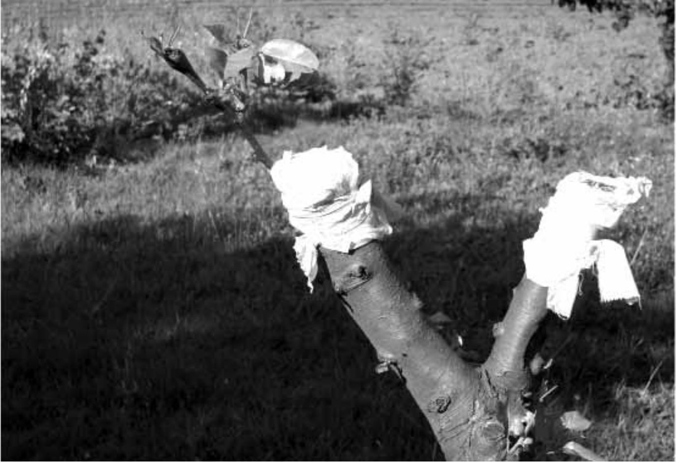
Çoban aşısı. (Resim 2)

kaynaklanmaktadır. Amerikalılar en iyi incirden çelik istemiş ve almışlardır; kimsenin aklına dağda bayırda kendiliğinden yetişen ve yenebilir meyve bile vermeyen erkek incir ağacından çelik kesip göndermek gelmemiştir.