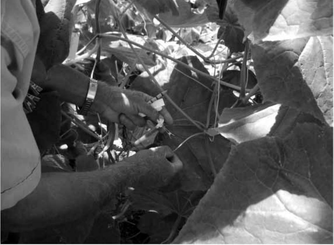
Çengelköy hıyarının ıslah çalışması. (Resim 3)

genetikçiler için ufuk açan diğer bir eseri vardır ki, bizde kimse bilmez. Evcilleştirilmiş bitki ve hayvanlardaki değişimi anlatan 1868 tarihli The Variation of Animals and Plants Under Domestication kitabı bahçe bitkileri ıslahında çığır açmış olan Luther Burbank'ı (McDonalds'da satılan patatesi ve halen yediğimiz birçok sebze ve yarma şeftali gibi meyve çeşidini geliştiren ıslahçı) olduğu kadar genetiğin babası sayılan Mendel'i de derinden etkilemiştir.